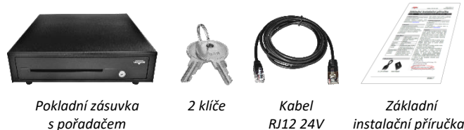
Pokladní zásuvka s pořadačem